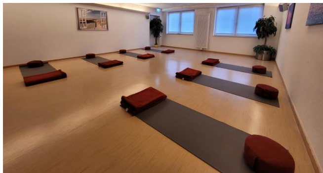
Yogaraum, Peterstr. 6

Termine: Freitag, 18.11.2022 - 16.12.2022, 10:00-11:30 Uhr (x 5)