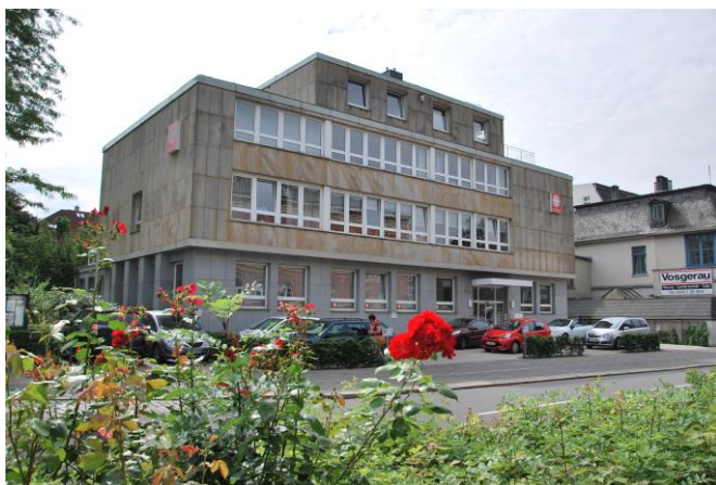
Unser Haus in der Peterstr.6 In Oldenbrug